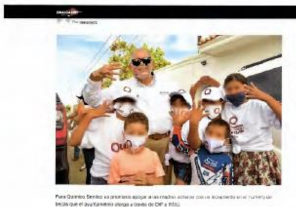
Para Químico Benítez es prioritario apoyar a las madres solteras con la solicitud en el turnero de becas que el ayuntamiento otorga a través de DIF e IMJU.

En el portal se encontraba la siguiente imagen.