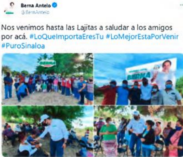
8:12 p. m. · 11 abr. 2021 · Twitter for iPhone

11 DE ABRIL 2021: https://twitter.com/BernAntelo/status/1381430057202282503