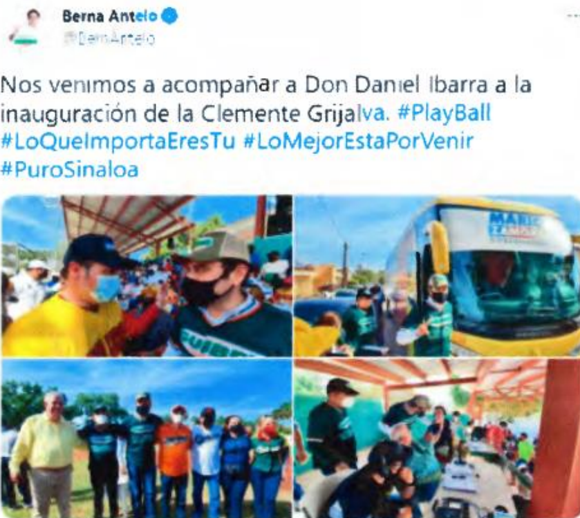
12:14 p. m. · 11 abr. 2021 · Twitter for iPhone

Para el efecto, la autoridad responsable bajo sus facultades de investigación, realizó una investigación en redes sociales, advirtiendo lo siguiente: