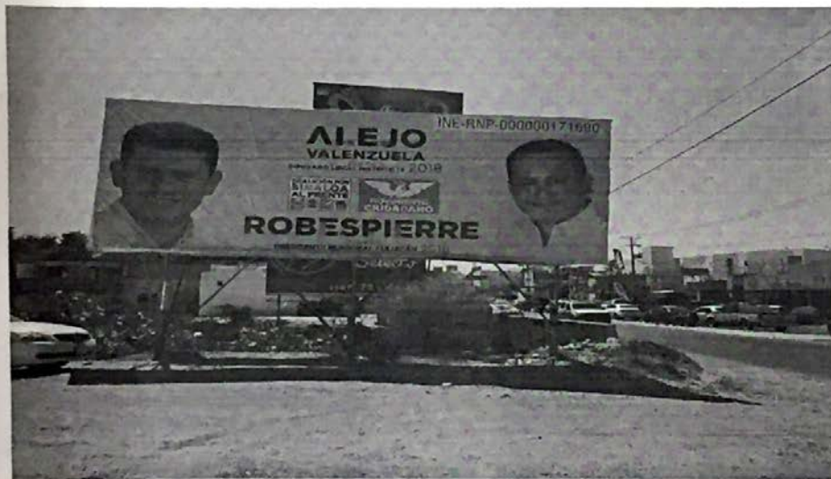
Imagen 2. Espectacular que se aprecia contiguo a un dren lleno de maleza